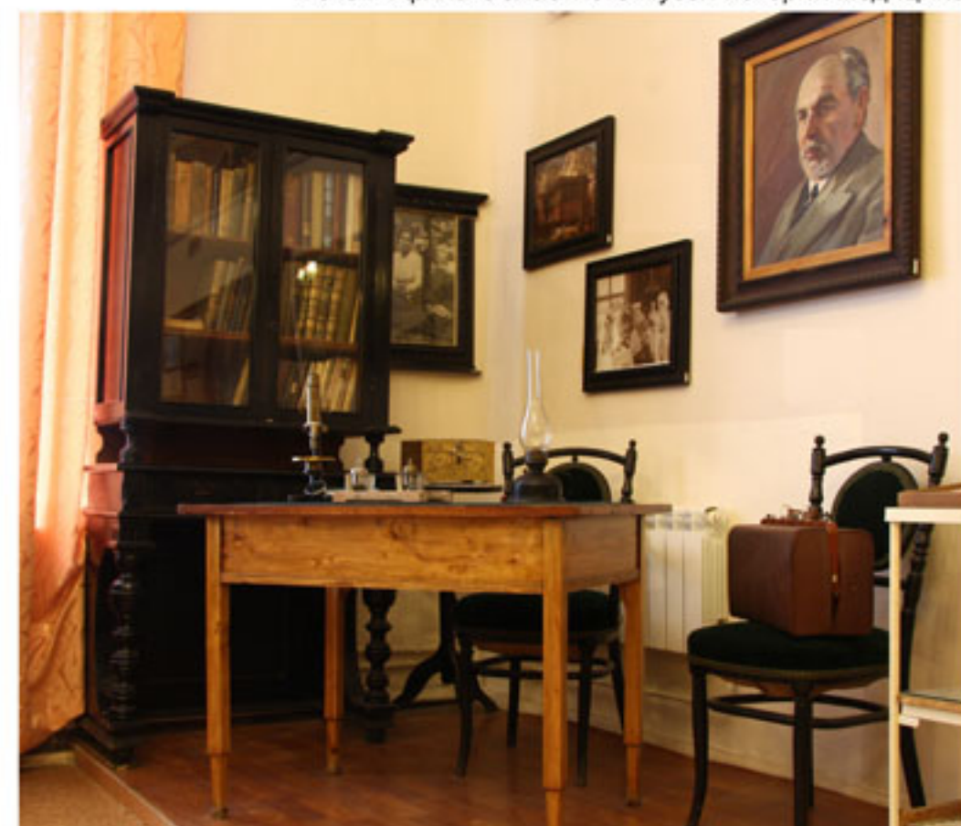
Кабинет земского врача