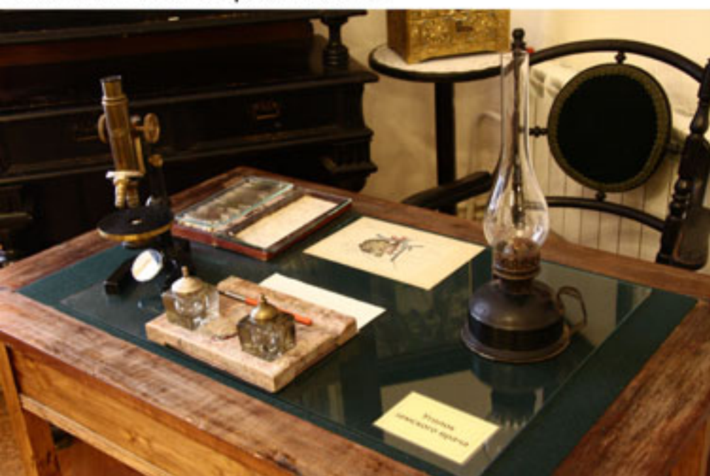
Письменный стол земского врача

Биографическая справка Порсевой В.И. Гол.арх. 3447 / Музей ОКБ арх.№ 1453