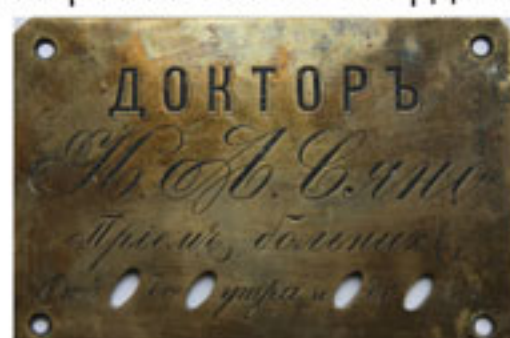
Медная табличка на кабинет И.А. Сяно