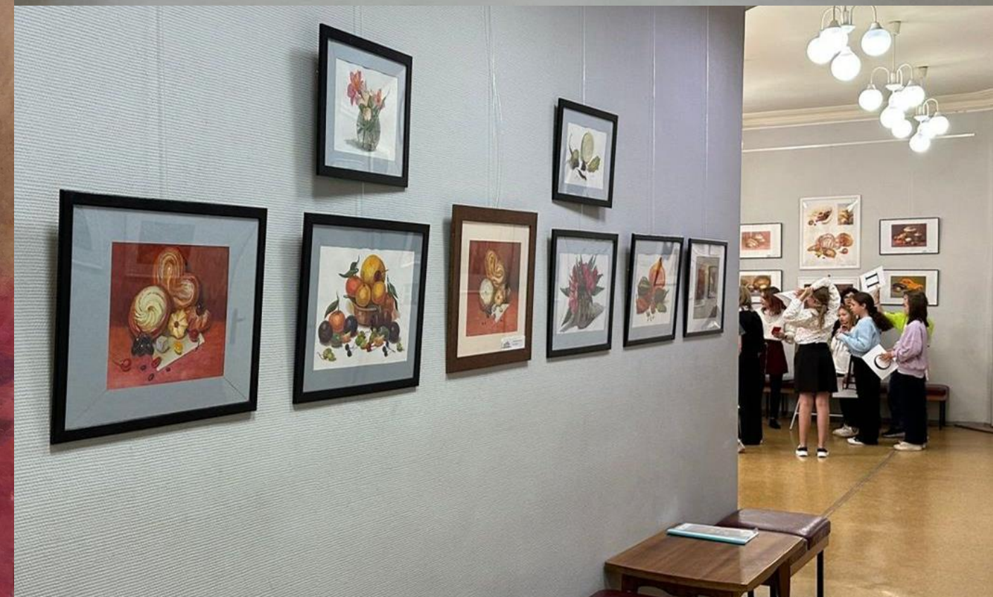
Методическая выставка работ преподавателей детских школ искусств Екатеринбурга «МИР АКВАРЕЛИ»